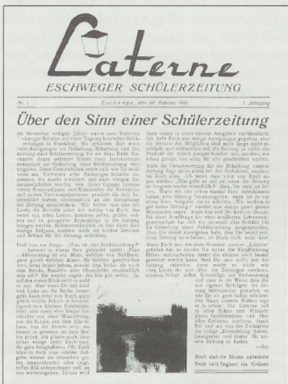
Titelseite der Nr. 1

„Im November vorigen Jahres (1950) waren zwei Vertreter Eschweger Schulen auf einer Tagung hessischer Schülerzeitungen in Frankfurt. Sie erhielten dort wertvolle Anregungen zur Gründung, Erhaltung und Gestaltung einer Schülerzeitung, die sie dann Ende November einem weiteren Kreise, einer Interessengemeinschaft zur Gründung einer Schülerzeitung weitergaben. Diese Gemeinschaft setzte sich, wie Ihr wohl wisst, aus Vertretern aller Eschweger Schulen zusammen. Sie wurde erweitert, und nach einigen Zusammenkünften wurde von dieser Gruppe interessierter Kameradinnen und Kameraden die Redaktion und andere Vertrauenspersonen gewählt, die sich bereiterklärten, die Zeitung mitzuwirken....“ Ein erstes „Impressum“ weist aus: